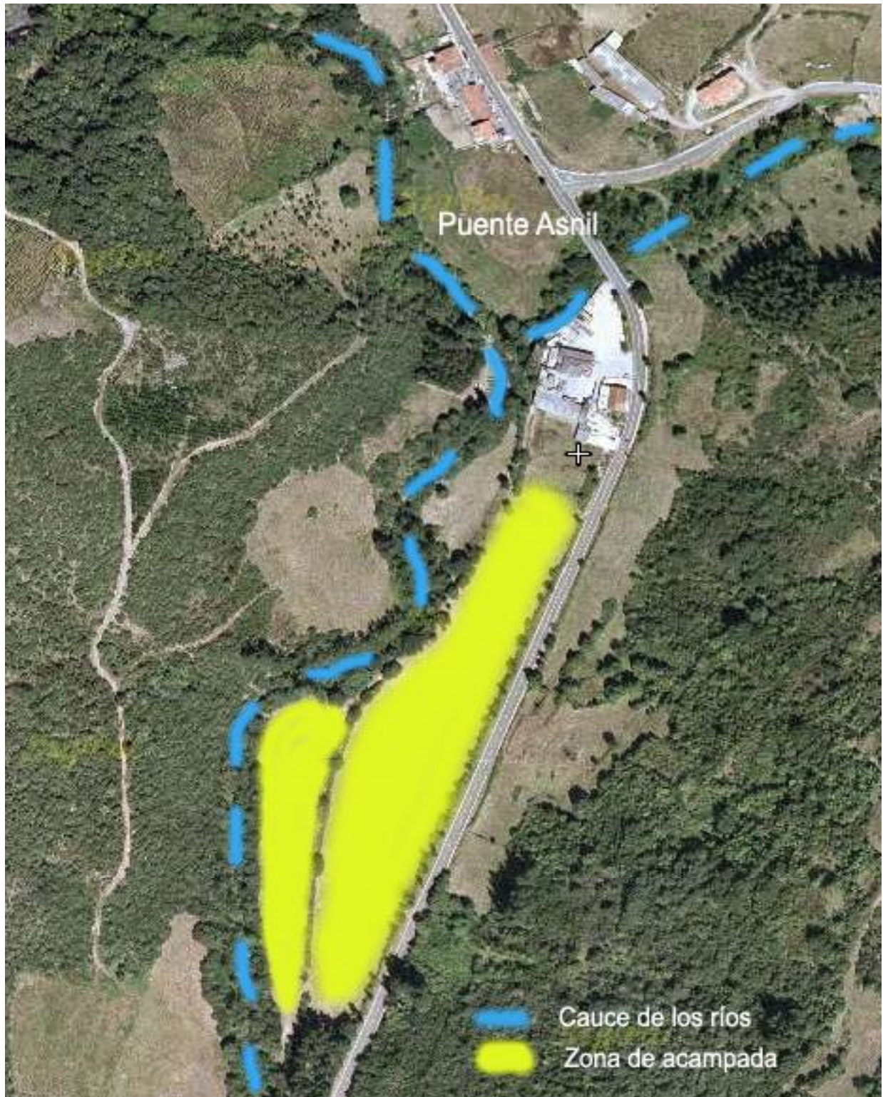
Imagen 2: El terreno de Campamento a vista de pájaro

El terreno escogido este año tiene el aspecto de la Imagen 2. Está situado al lado de Puente Asnil, en la misma carretera por la que hemos llegado. Como podéis ver, contamos con amplias explanadas para jugar y algunas zonas de sombra.